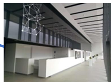
Hall de réception avec bar 132m 2