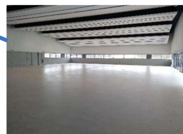
Salle principale 738m 2