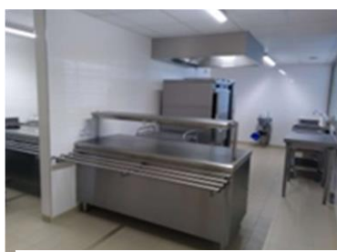
Cuisine professionnelle 40m 2