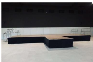
Estrade 56m 2