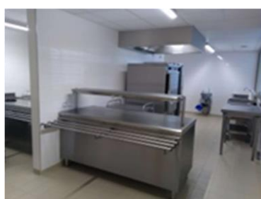
Cuisine professionnelle 40m 2