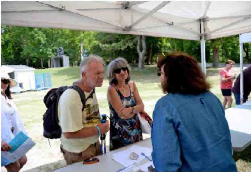
Le parc de Champagne et son village Unesco ont vu arriver les premiers randonneurs vers 8 h 30 hier. J.B.