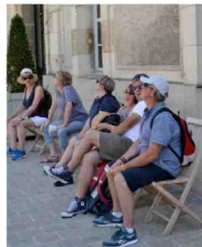
La seconde cour du Palais du Tau a été ouverte exceptionnellement aux participants à cette 4 e Marche des réconciliations. J.B.