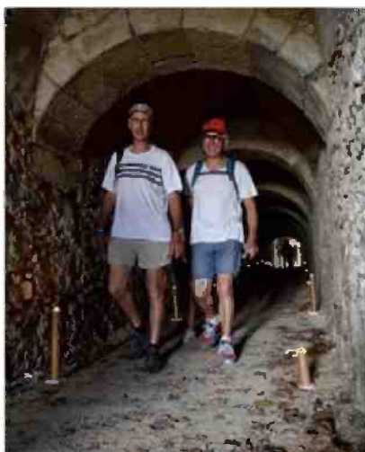
Visite insolite du souterrain situé sous les remparts de la Butte Saint-Nicaise. J.B.