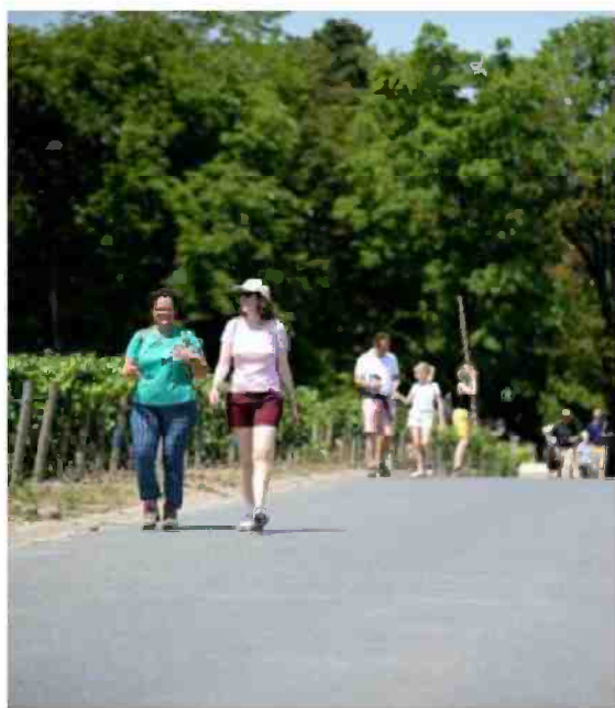
Passage dans la Maison Vranken-Pommery. J.B.