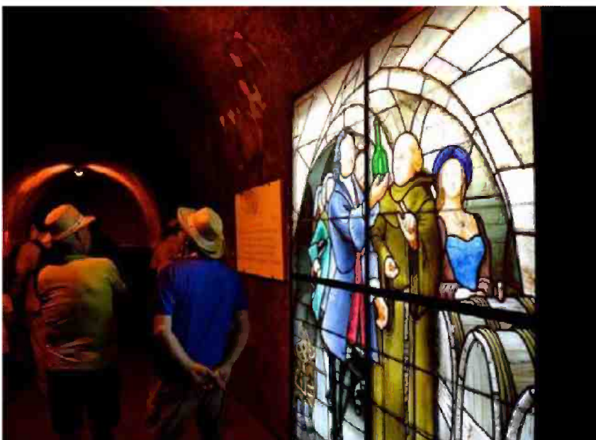
Expositions, visites et animations diverses ont égayé les différentes étapes des parcours. Ici, les randonneurs ont pu pénétrer dans une crayère de la maison Taittinger. J.B.