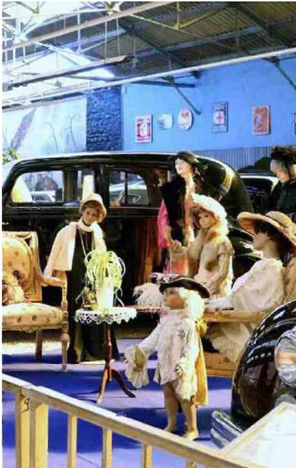
REIMS Au Musée Automobile de Reims-Champagne, les visiteurs ont pu découvrir quelque 250 véhicules et plus de 6000 miniatures... mais pas seulement ! La nouveauté appréciée, pour ces journées du patrimoine, c'était la mise en scène des « anciennes » avec des mannequins, en tenue, notamment de la Belle Époque et des Années Folles, grâce au don d'une rémoise collectionneuse de vêtements d'époque. À découvrir ce dimanche de 10 à 12 heures et de 14 à 18 heures. Entrée 5 € au lieu de 9 €. Françoise Lapeyre