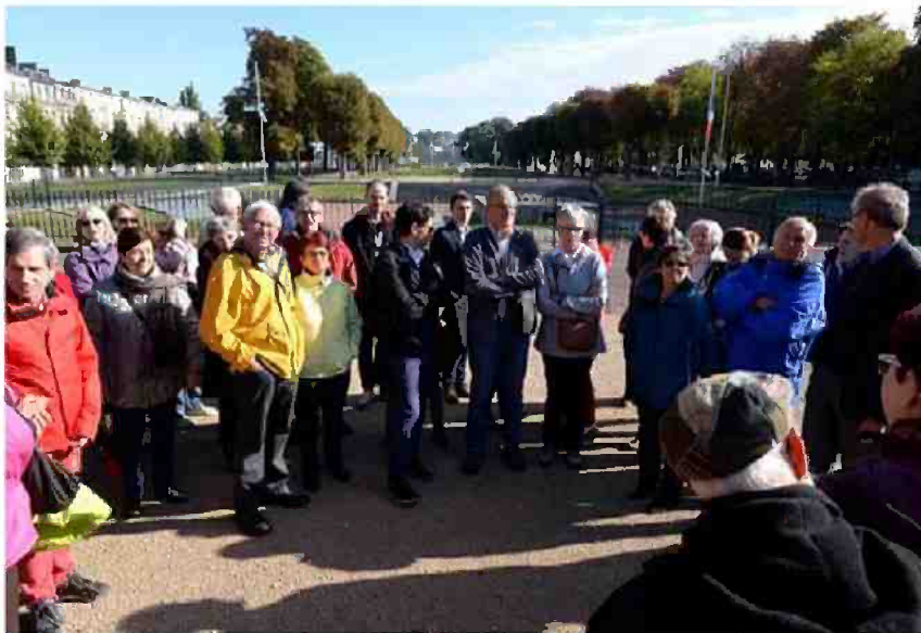
REIMS Les promenades, au cœur du projet Reims Grand Centre, ont accueilli hier de nombreux visiteurs curieux de découvrir les futurs aménagements de cet espace vert historique du centre-ville. Christian Lavrenco